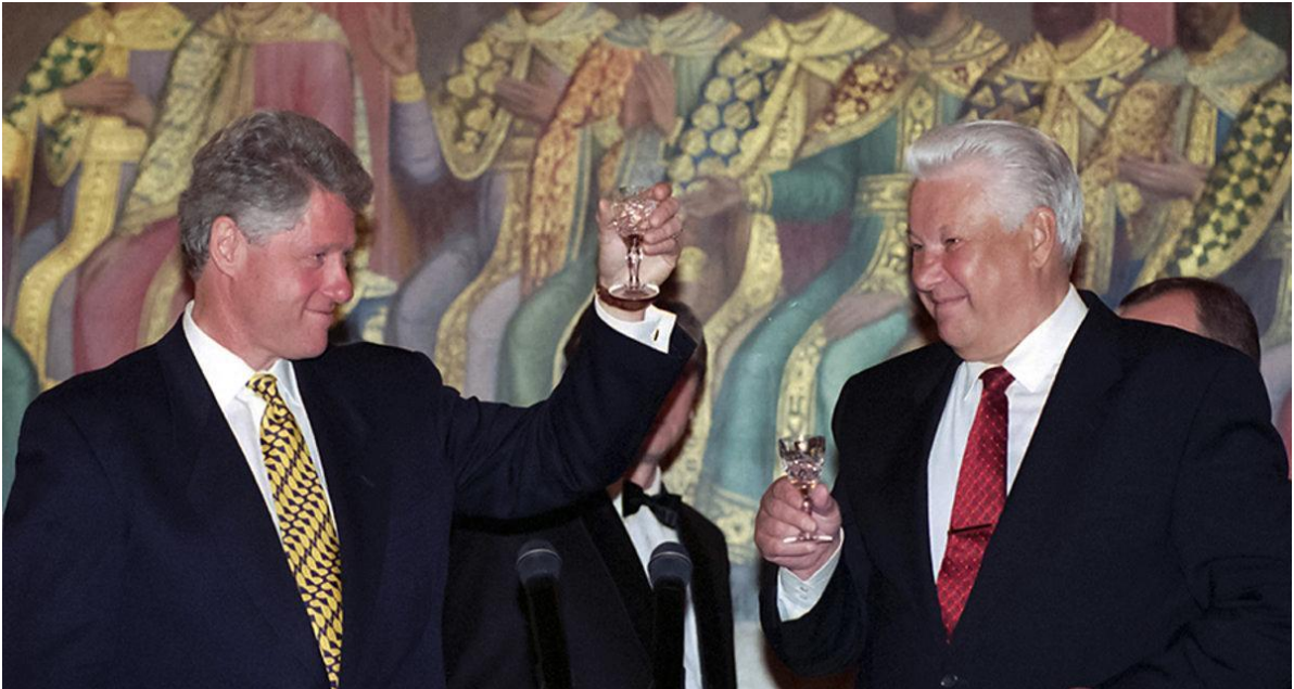
El presidente Clinton y el presidente Yeltsin brindan en la cena de estado, Hall of Facets, The Kremlin, Moscú, mayo de 1995

El presidente ruso hizo creer que la Asociación para la Paz era una alternativa a la OTAN ampliada. Los documentos muestran una temprana oposición rusa a la "neocontención"; más garantías estadounidenses a Rusia: "inclusión, no exclusión" en las nuevas estructuras de seguridad europeas