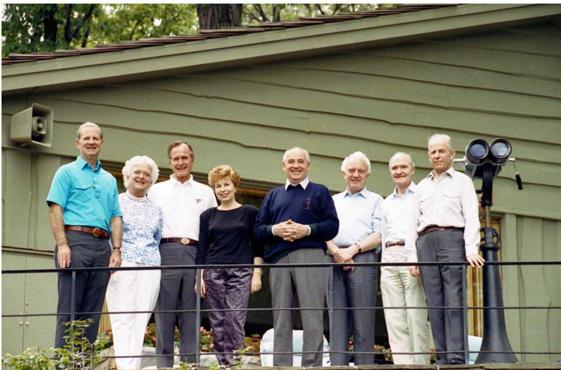
Los directores se reunieron para una foto grupal en Camp David, todo sonrisas excepto el mariscal soviético a la derecha. Desde la izquierda, Baker, Barbara Bush, el presidente Bush, Raisa Gorbacheva, el presidente Gorbachev, Shevardnadze, Scowcroft, Akhromeyev. 2 de junio de 1990.