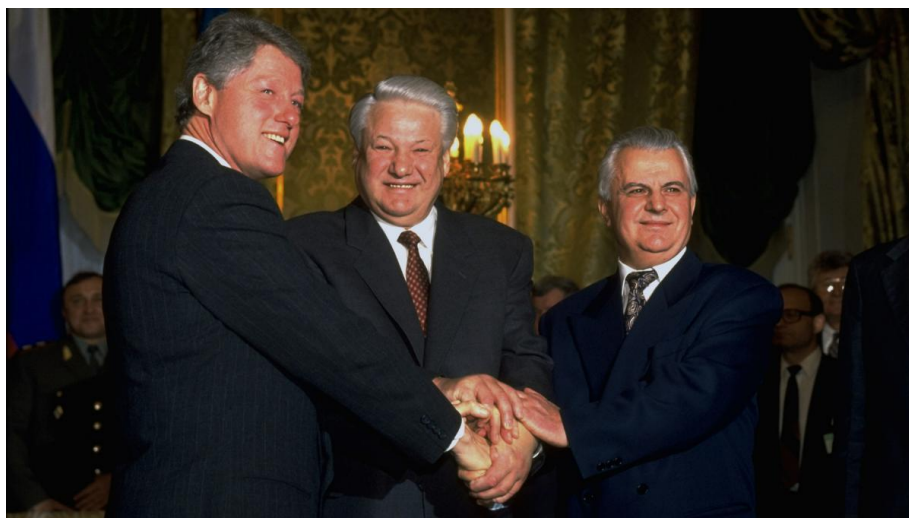
El presidente Clinton, el presidente Yeltsin y el presidente Leonid Kravchuk de Ucrania se dan la mano sobre el acuerdo de desnuclearización en Moscú, enero de 1994