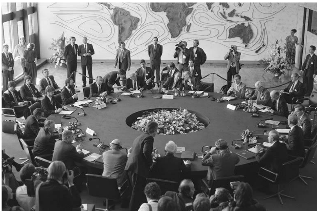
Primera ronda oficial de negociaciones Dos más Cuatro, con los seis ministros de Asuntos Exteriores, en Bonn el 5 de mayo de 1990.