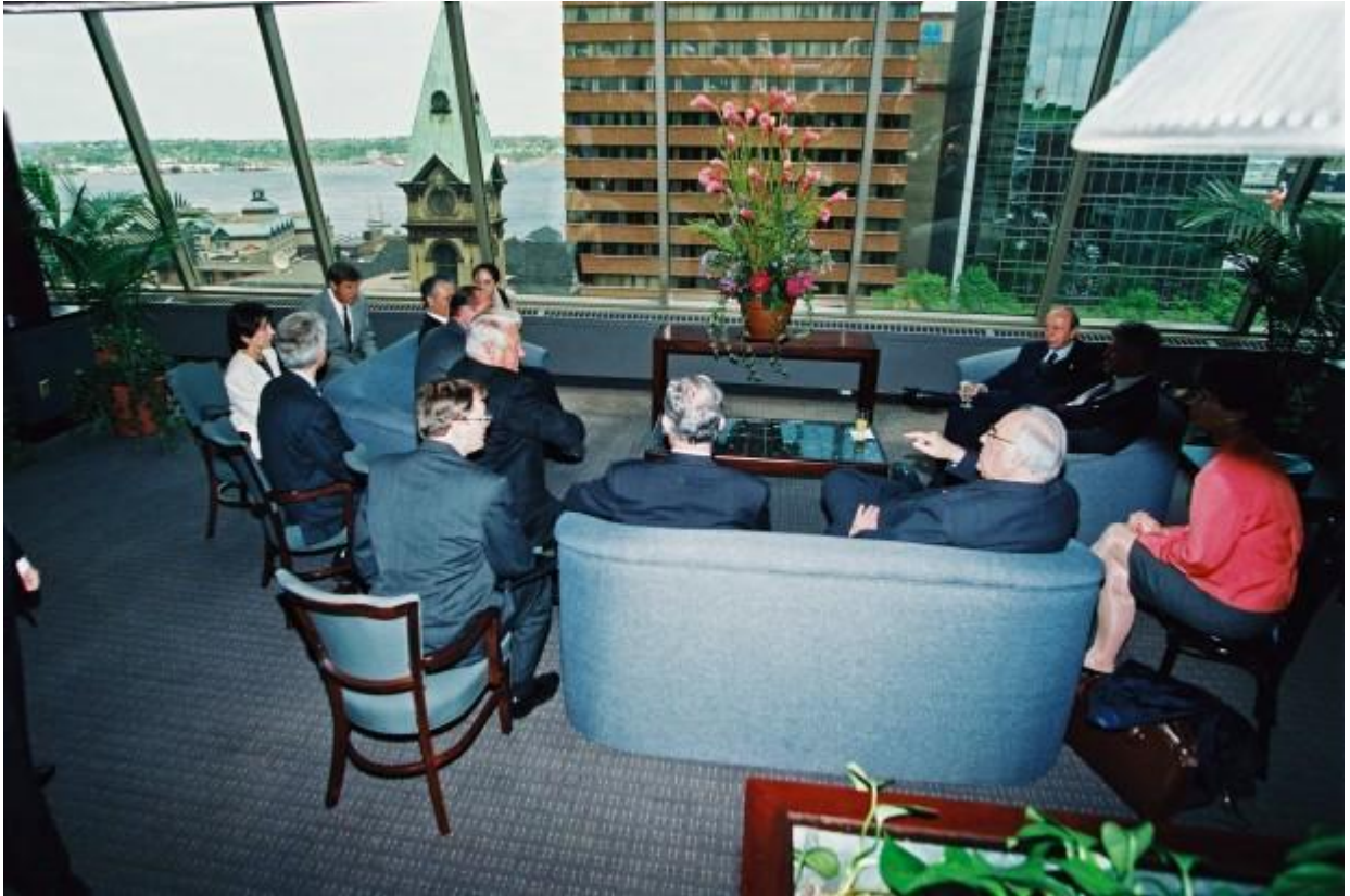
El presidente Clinton y el presidente Yeltsin en Halifax, Nueva Escocia, 17 de junio de 1995