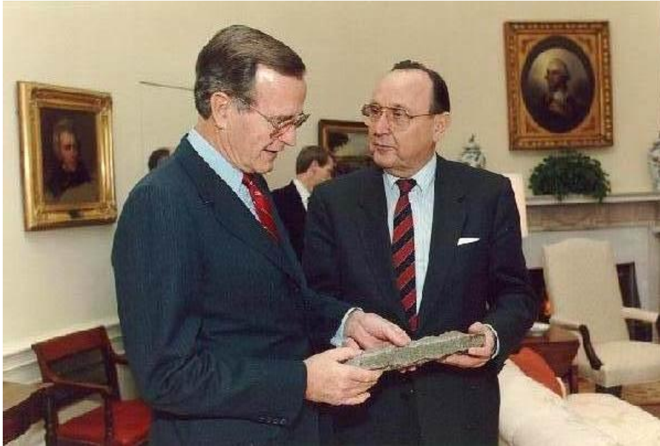
El Ministro de Relaciones Exteriores Genscher entrega al Presidente Bush un trozo del Muro de Berlín, Oficina Oval de la Casa Blanca, Washington, DC, 21 de noviembre de 1989.