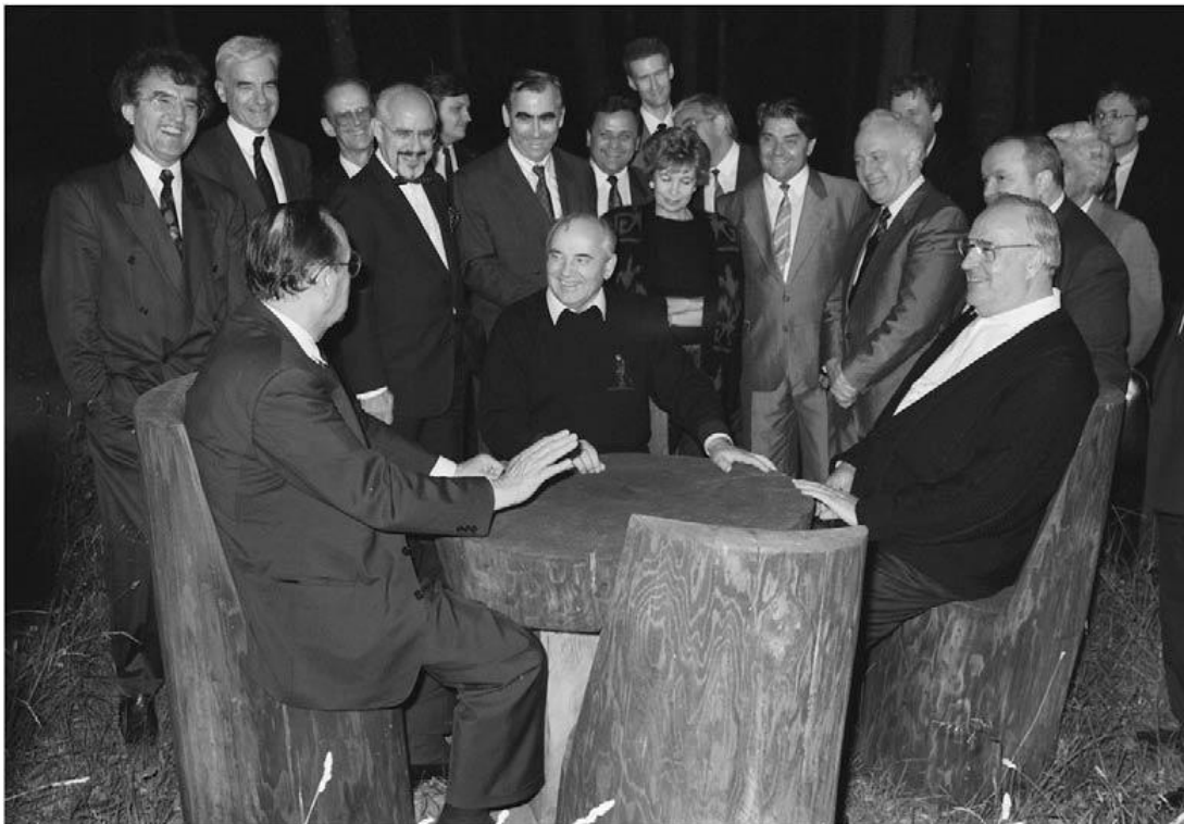
Michail Gorbachev discutiendo la unificación alemana con Hans-Dietrich Genscher y Helmut Kohl en Rusia, 15 de julio de 1990.