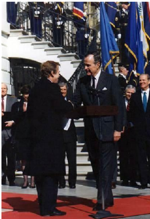
El presidente Bush saluda al presidente checo Vaclav Havel fuera de la Casa Blanca, Washington, DC, 20 de febrero de 1990.