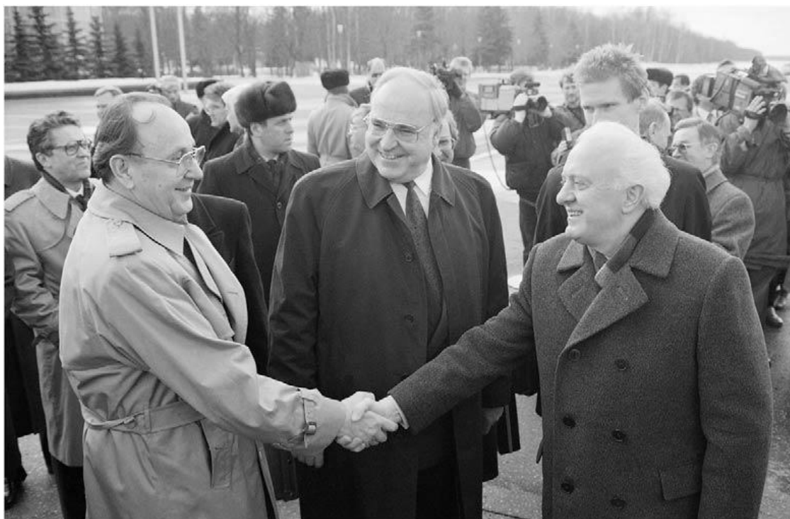
Eduard A. Shevardnadze (derecha) saluda a Hans-Dietrich Genscher (izquierda) y Helmut Kohl (centro) a su llegada a Moscú el 10 de febrero de 1990 para hablar sobre la reunificación alemana.