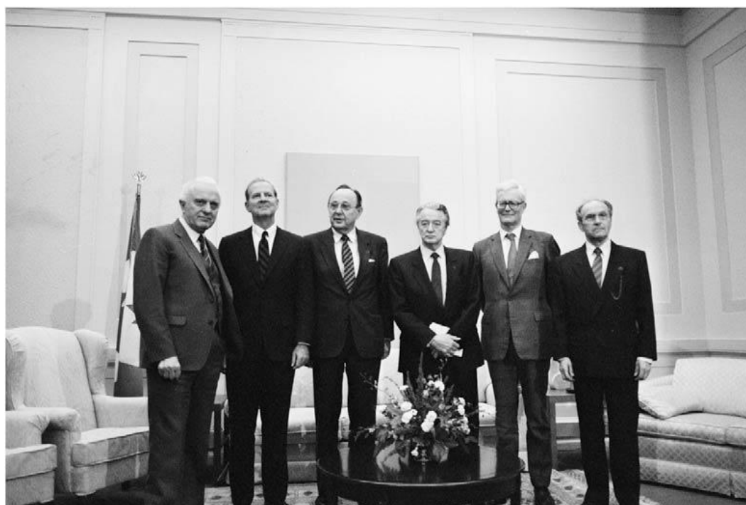
El acuerdo para iniciar las conversaciones Dos más Cuatro es presentado a la prensa por los seis ministros de Relaciones Exteriores en la Conferencia "Cielos Abiertos" en Ottawa el 13 de febrero de 1990. De izquierda a derecha: Eduard Shevardnadze (URSS), James A. Baker (EE.UU.), Hans-Dietrich Genscher (RFA), Roland Dumas (Francia), Douglas Hurd (Gran Bretaña), Oskar Fischer (RDA).