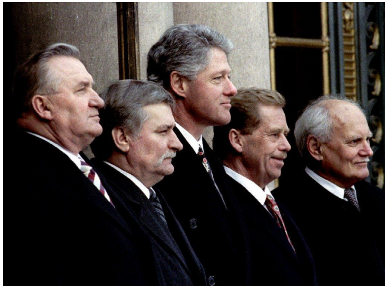
Desde la izquierda, el presidente Michal Kovac de Eslovaquia, el presidente Lech Walesa de Polonia, el presidente Bill Clinton, el presidente Vaclav Havel de la República Checa y el presidente Arpad Goncz de Hungría, en Praga, el 12 de enero de 1994

de estos fueron articulados por sus líderes en las reuniones con el presidente Clinton en enero de 1994 que se publican aquí. La publicación tampoco proporciona ninguna evaluación neta de las ganancias y pérdidas para la seguridad estadounidense y europea a partir de la expansión de la OTAN. Más bien, el enfoque de esta colección de documentos es simplemente lo que el presidente ruso, Boris Yeltsin, escuchó de la administración Clinton sobre la expansión de la OTAN en la primera mitad de la década de 1990, y las repetidas objeciones rusas que fueron repetidamente descartadas por los funcionarios de la administración Clinton.