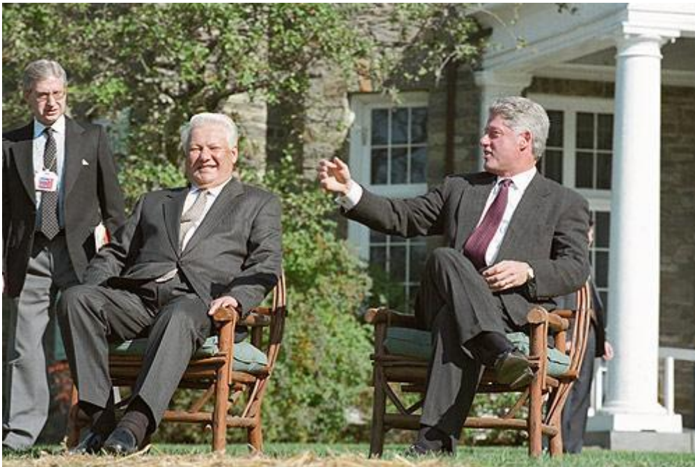
El presidente Yeltsin y el presidente Clinton en Hyde Park, Nueva York, octubre de 1995