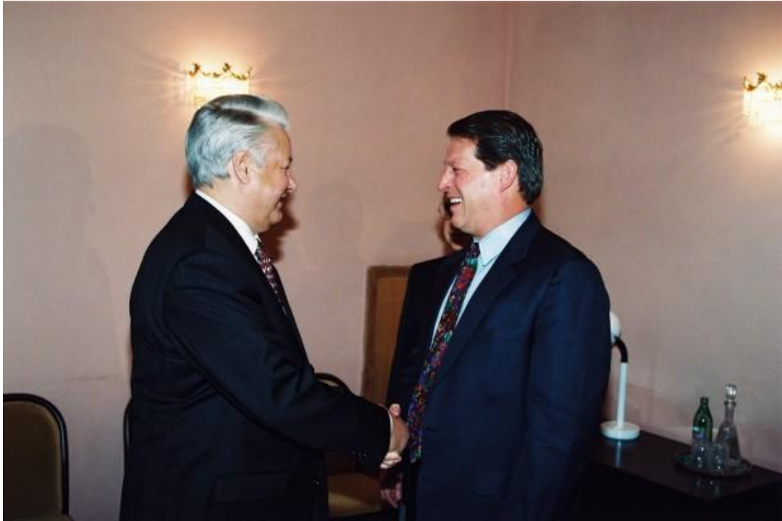
El presidente Yeltsin con el vicepresidente estadounidense Al Gore en Moscú, diciembre de 1994