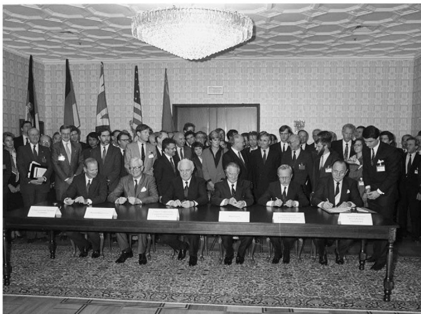
De derecha a izquierda: el Ministro de Relaciones Exteriores Hans-Dietrich Genscher (FRG), el Ministro Presidente Lothar de Maizière (RDA) y los Ministros de Relaciones Exteriores Roland Dumas (Francia), Eduard Shevardnadze (URSS), Douglas Hurd (Gran Bretaña) y James Baker (UU.) firman el llamado Acuerdo Dos más Cuatro (Tratado sobre el Acuerdo Final con respecto a Alemania) en Moscú el 12 de septiembre de 1990.